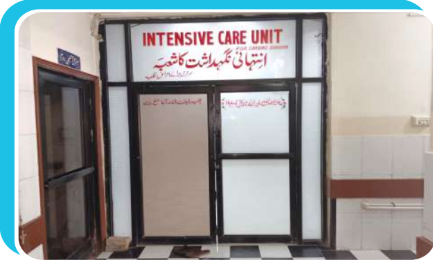
ICU کی انٹرنس کی تصویر