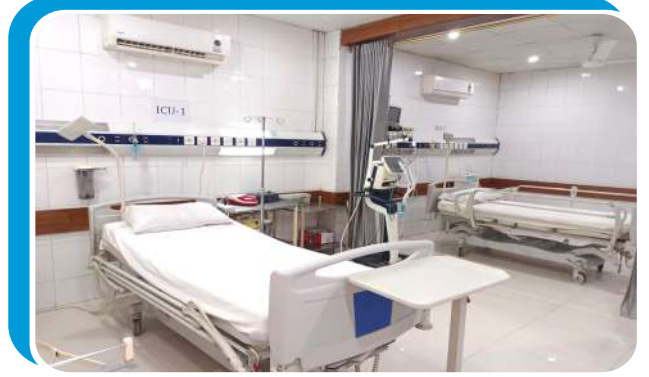
ریڈ کریسنٹ انسٹیٹیوٹ آف کارڈیالوجی اینڈ جنرل ہسپتال لطیف آباد نمبر 2 میں ICU کا قیام۔