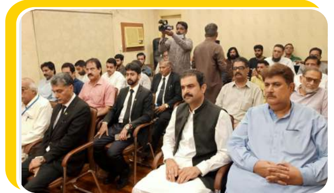
کینسر وارڈ کے افتتاح کے دوران لی گئی تصاویر