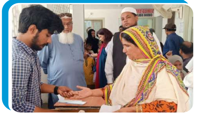
میڈیکل کیمپ کے افتتاح کے موقع پر لی گئی تصاویر