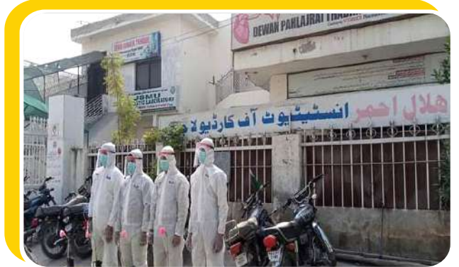
جراثیم کش مہم کی ٹیم کا ہلال احمر ہسپتال میں جراثیم کش اسپرے