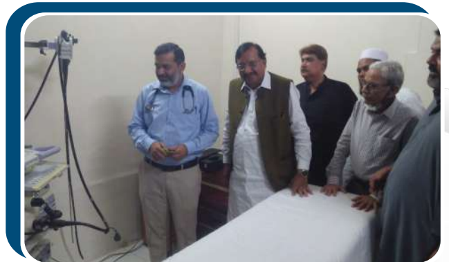
ہلال احمر جنرل ہسپتال میں انڈوسکوپ سوٹ کے افتتاح کے موقع پر لی گئی تصویریں