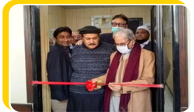
PPHI کے تعاون سے ریڈ کریسنٹ جنرل ہسپتال میں نیوٹریشن پروگرام کا افتتاح۔