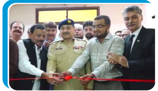
کارڈیک و جنرل ہسپتال یونٹ نمبر 2 میں کینسر کے وارڈ کے افتتاح کی تصاویر